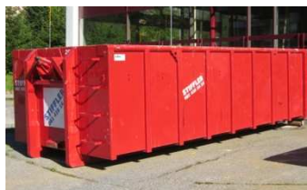
Mulde 20m 3