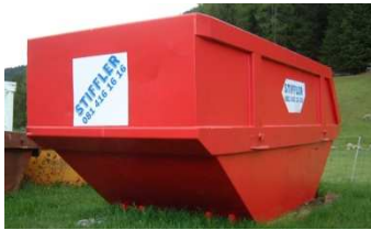
E-Mulde, 13m 3