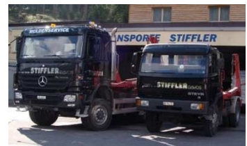
Lastwagen, 2- oder 3-Achser 4x4