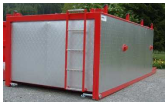
Thermosilo, max. 12T