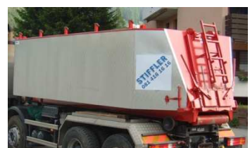
2 - Kammern Thermosilo, max. 16T