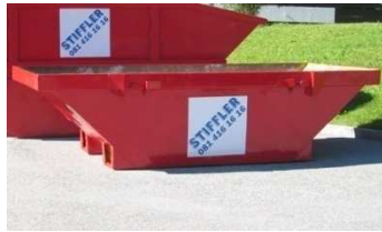
A-Mulde, 4m 3 / B-Mulde, 6m 3 / Stadt-M.