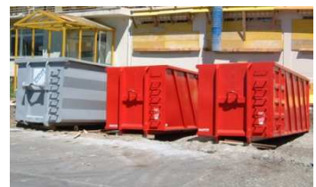
Mulde 32 - 40m 3