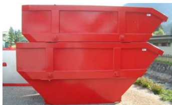
D-Mulde Bohrschlamm 5m 3 / Sperrgut 7m 3