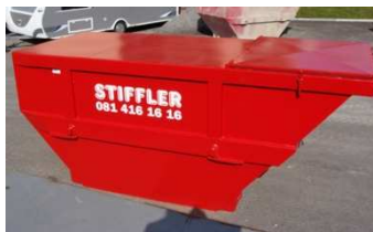
D-Mulde, Bohrschlamm, 6m 3 m. Deckel