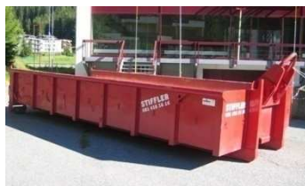
Mulde 10m 3 , Auffahrtor