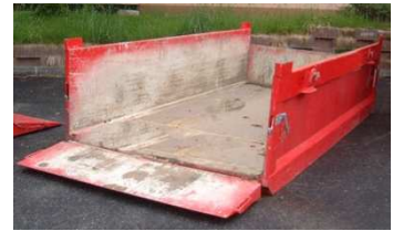
C-Mulde, 7m 3 Auffahrtore/ Flügeltore