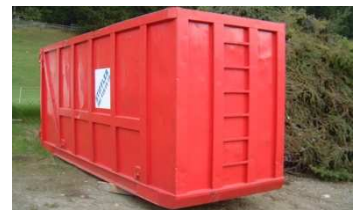
Grossmulde, 20 – 22m 3