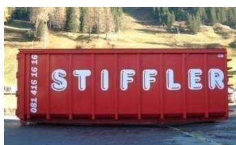
Deckelmulde 32 - 36m 3