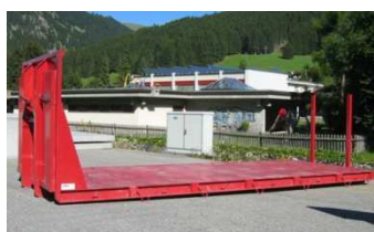
Plattformen, div. Grössen